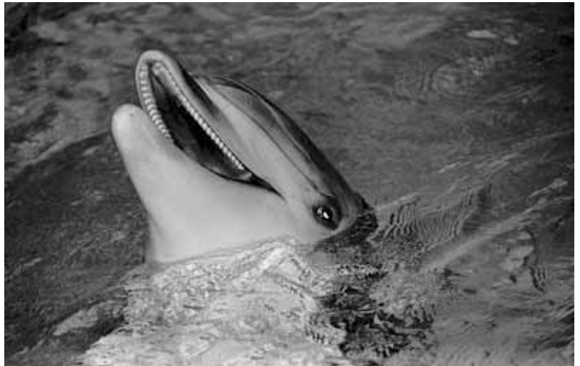
Abb. 1: Schwarz-Weiss-Portrait eines Grossen Tümmlers: Diesen Meeressäuger fehlen in ihren Augen die Blauzapfen, sie besitzen nur Grünzapfen. Der evolutive Vorteil des Blauzapfenverlustes bei Meeressäugern ist rätselhaft, denn in klarem Meerwasser wird das Licht mit zunehmender Tiefe immer blauer.